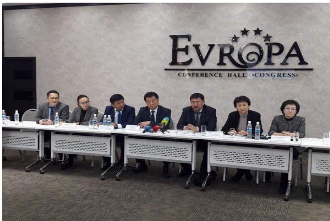
Участники круглого стола по лекарственному обеспечению.

12 января в Бишкеке прошел круглый стол, посвященный теме улучшения ситуации с лекарственным обеспечением в стране. На мероприятии участвовали министр Здравоохранения КР Т.Батыралиев, депутаты ЖК, представители ряда государственных органов и члены общественного совета Минздрава.