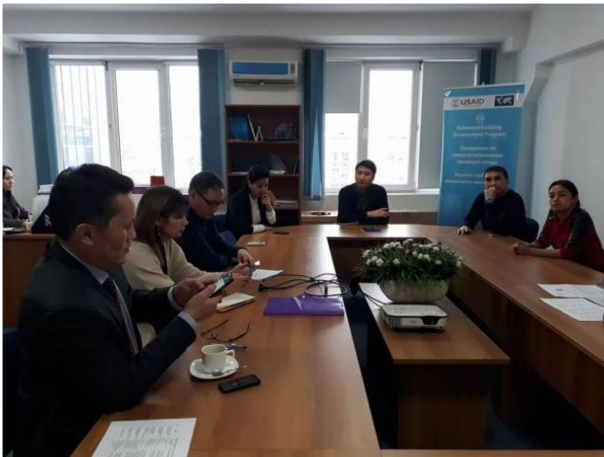
Члены ОС МЗ.

Комиссия по отбору членов ОСГО на своем заседании, которое прошло 23.12.2017 г. утвердила состав ОС Министерства здравоохранения.