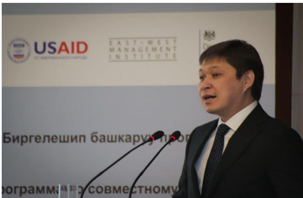
С.Исаков во время выступления.

«ОС должны стать равноправными партнерами руководителей государственных органов, содействуя им в работе и помогая в решении актуальных вопросов, включая борьбу с коррупцией. Правительство придает большое значение сегодняшней конференции, в ходе работы которой необходимо выработать эффективные механизмы совершенствования работы общественных советов, повышения привлекательности работы в них и взаимодействия членов ОС непосредственно с руководителями государственных органов, которые должны оказывать им всяческое содействие и помощь.» , — подчеркнул Сапар Исаков.